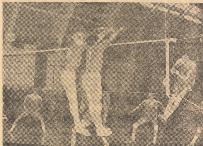
Dinamovistul Vrincuț atacă în forță, evitînd blocajul polonezilor Czapor și Koziarz.