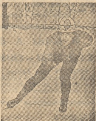
Tinărul bucureștean Orlando Cristea s-a numărat printre câștigătorii probelor de sprint

Campionatele Internaționale ale României, ediția 1987, desfășurate, în premieră, simbătă și duminică, pe noua pistă naturală din Suceava, au creat o adevărată emulație printre a-