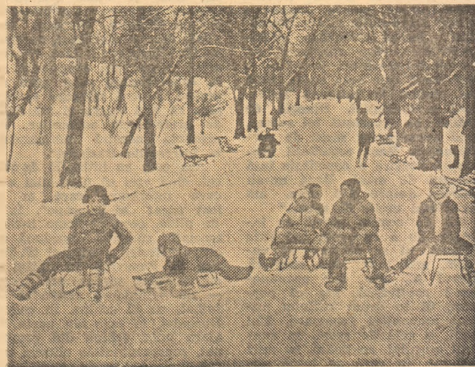
Instaurată în drepturile ei, țarna invită la săniuș. Alea unui pare bucureștean din preajma Academiei Militare a fost transformată într-o veritabilă pistă de concurs de copii îmbujorași și veseli...

La probele poliathlonului mic (500, 1500, 1000, 3000 m fete: 500, 3000, 1500, 5000 m băieți la juniori I: 500, 1500, 1000 și 3000 m la junioare și juniori II) participă tineri alergători din București, Brașov, Ploiești, Sibiu, Miercurea Ciuc, Tg. Mureș, Cluj-Napoca și alte centre din țară.