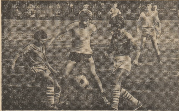
Și în rîndul copiilor, fotbalul, cu momentele sale imprevizibile, de mare frumusețe, produce o fascinație greu egalabilă.

● Fotbaliștii de la Universitatea Craiova pot fi optimiști: la Casa pionierilor și șoimilor