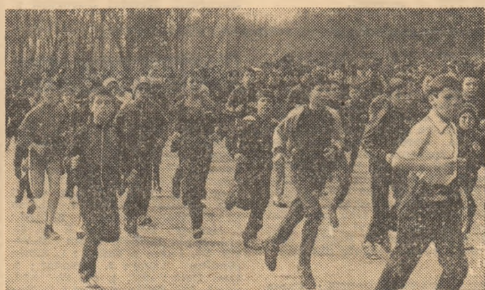
A venit primăvara Firesc, alergările în aer liber, crosurile sînt la ordinea zilei. Mii de iubitori ai mișcării, de la soimii patriei pînă la... bunici, se aliniază cu bucurie la startul acestor întreceri dătătoare de sănătate. O dovadă elocventă, instantaneu surprins recent în Parcul „23 August” din Capitală, la un cros rezervat elevilor.