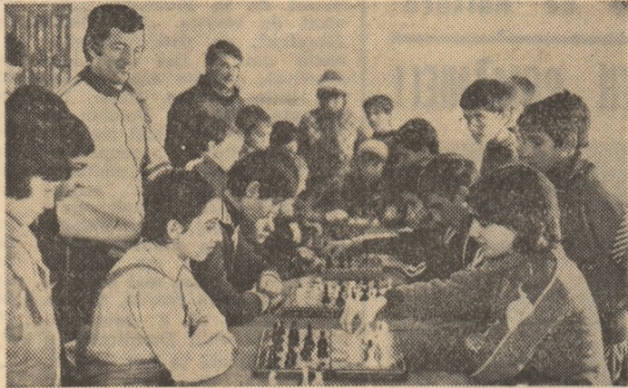
În zilele mai puțin însorite, șahul polarizează atenția multor pionieri și școlari...