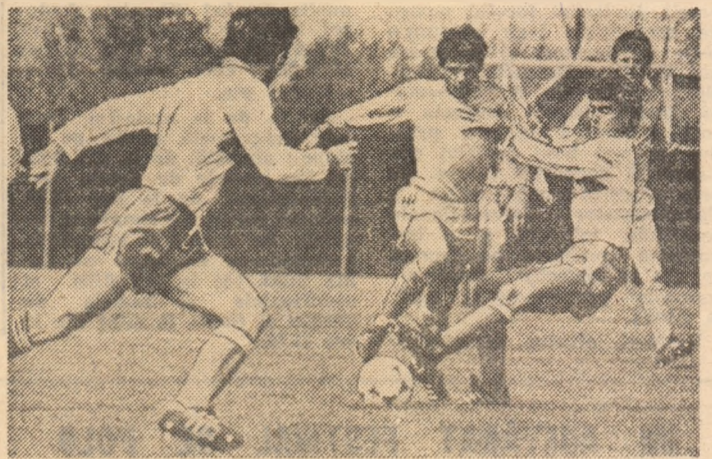
Impetuoasa aripă Mihai încearcă să treacă de defensiva oaspeților

Start de bun augur al reprezentativei noastre de juniori I în cadrul preliminarilor Campionatului European, elevii antrenorilor Constantin Ardeleanu, Alexandru Lazăr și Iosif Varga trînsînd în favoarea lor prima partidă din grupă, parteneri fiindu-le juniorii turci. Tabela de marcaj a consemnat în final un 3-1 mobilizator în perspectiva viitoarelor întîlniri, dar mai ales pentru cea mai apropiată, de la 26 iunie, tot pe teren propriu. În compania echipei U.R.S.S., principala contracandidată la primul loc în grupă, cel care conferă dreptul de promovare la turneul final. Tocmai de aceea considerăm că, pe lângă aprecierile favorabile care se cuvin pentru acest prim succes, trebuie insistat și asupra unor carente care și-au făcut loc în jocul de ansamblu al tinerilor noștri tricolori, astfel încît ele să constituie punctul de plecare al preparativelor în vederea dificilului meci cu echipa U.R.S.S. Alfel spus, și din victorie trebuie învățat!