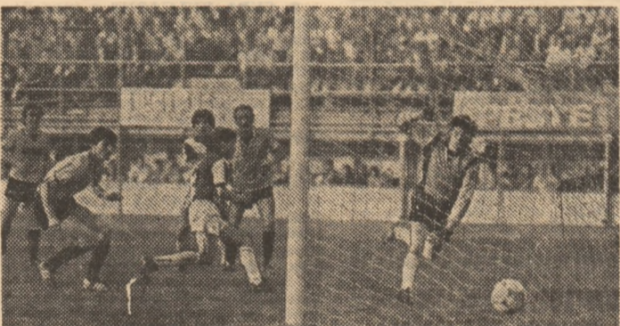
Portarul Călugăru (Oțelul) răsuflă ușurat: un nou atac rapidist s-a soldat cu o nouă ratare, mingea ocolînd barele porții gălățene (Fază din meciul Rapid — Oțelul Galați 1-0)