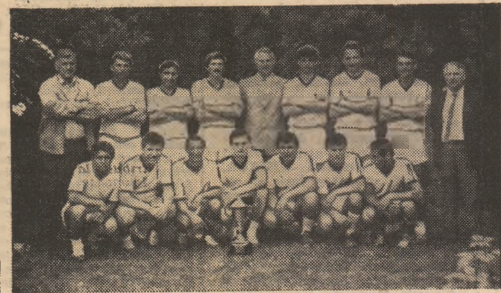
Dinamo București, noua laureată a Daciadei