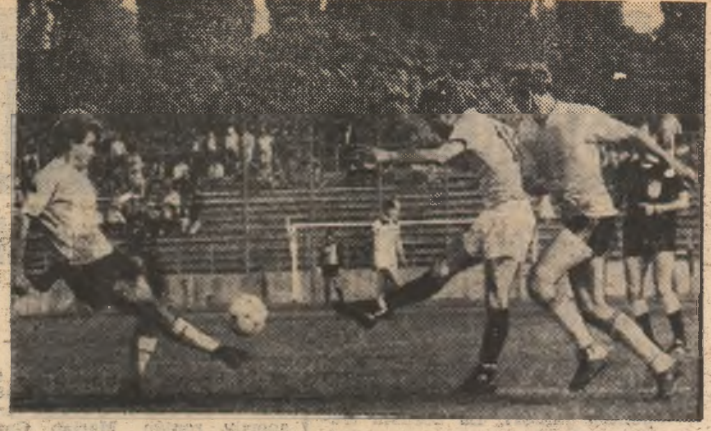
Min. 23 al partidei Sportul Studentesc - F.C.M. Brașov: Burehel ștergez puternic și deschide scorul.