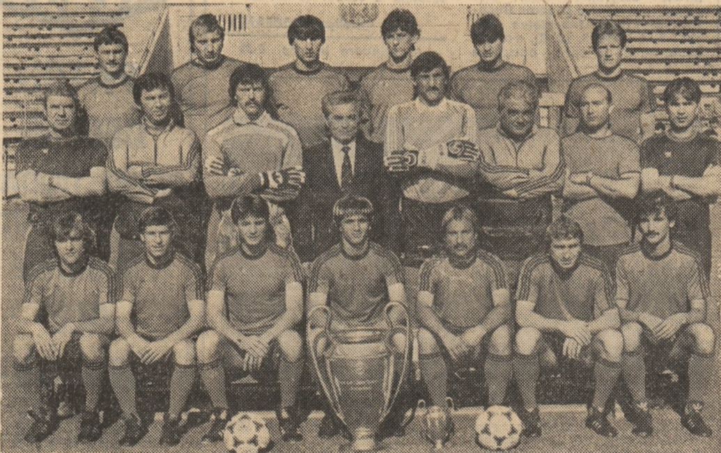
Fotbaliștii steliști și marele lor trofeu: Cupa Campionilor Europeni