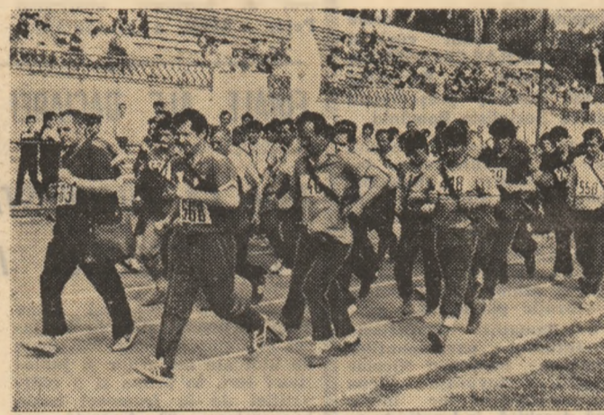
S-a dat startul în întrecerea poștașilor

Să mai amintim, în final, că la întrecere au participat peste 160 de concurenți de la toate oficiile poștale din București. Ion PANA — coresp.