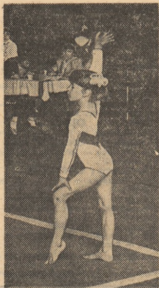
Gimnastica rămîne una dintre preferințele copiilor din municipiul și județul Constanța