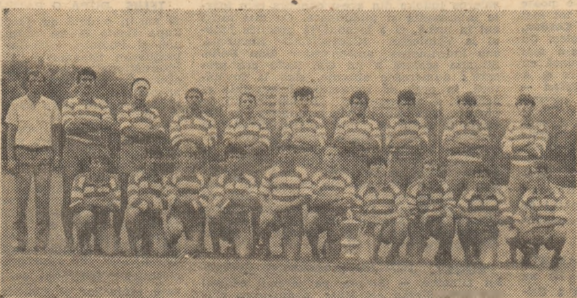
„XV”-le Rulmentului Birlad, pentru a doua oară câștigător al „Cupei României”