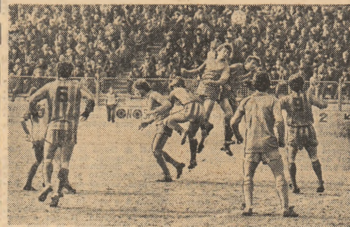
Fază din meciul F.C. Olt — Gloria Buzău. Careul oaspeților a fost deseori supraaglomerat, dar gazdele nu au reușit să fructifice ocaziile