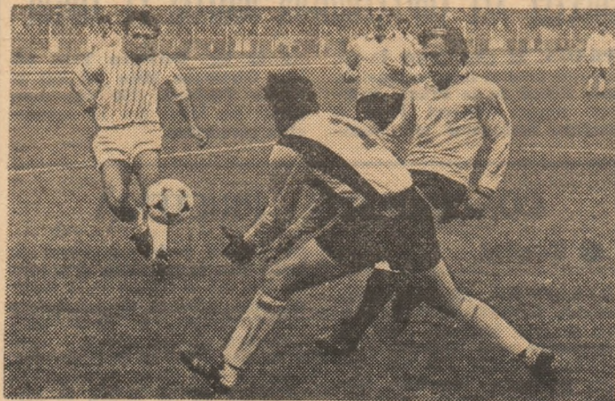
Agiu — unul dintre cei mai buni apărători ai Oțelului — gata să intervină la un balon care va poposi în brațele portarului Călugăru. Fază din partida Dinamo — Oțelul.

Cel mai mare dintre orașele noastre de la Dunăre a avut de-a lungul anilor, mai multe echipe în Divizia A. A fost cindva Gloria-C.F.R. Apo Siderurgistul, care a stopat Rapidul din cursa ei spre primul titlu. Iar mai de curind, Dunărea-C.S.U. Dar toate aceste echipe, după promovări spectaculoase, au dat replici timide pe prima noastră scenă fotbalistică — în ciuda faptului că Galațiul a rămas un nesecat izvor de talente — și s-au retras discret în Divizia B. S-a creat și așa izbită butadă din vremea de glorie a grupului suedez ABBA, afirmându-se despre echipa Galațiului că oscilează continuu între A și B. B și A! Și așa era.