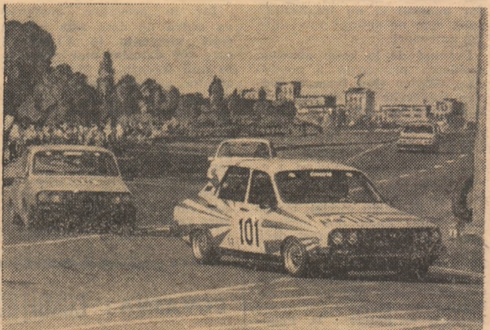
Concursurile de viteză pe circuit sînt urmărite mereu cu interes de către spectatori, ele oferind un frumos spectacol sportiv