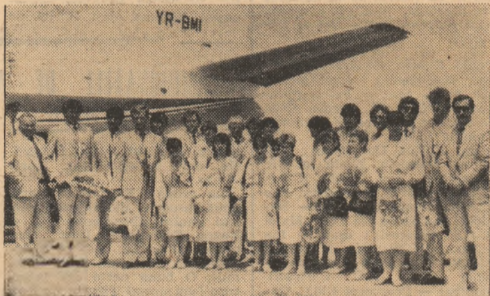
Loturile de caiac-canoe și gimnastică, ieri, la sosirea pe Aeroportul internațional Otopeni.