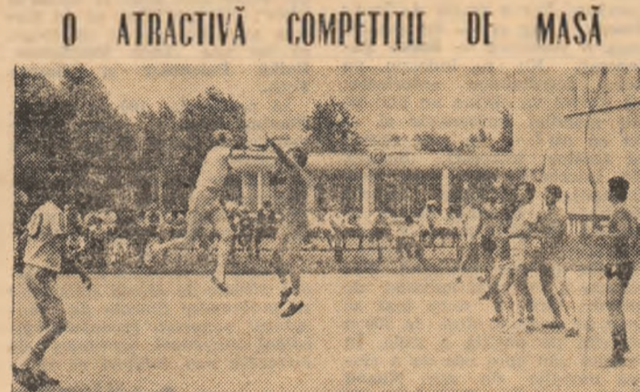
Intrecerile de handbal au fost urmărite cu interes la „Festivalul sportului muncitoresc călărășean”. In imagine, față din meciul disputat între formațiile Combinatului Siderurgic Călărăși și Re-colta București

„Festivalul sportului muncitoresc călărășean” a devenit o frumoasă și tradițională întrecere de masă, cu sute de competitori la start, an de an mai bine pregătiți, cu un bogat și atrăgător program, care de la o ediție la alta, își lărgeste aria de cuprindere. Astfel, la recenta manifestare desfășurată, timp de două zile în municipiul de pe Borcea, au participat peste 500 de sportivi, tineri și tinere, din județele Buzău, Constanta și, bineînțeles, Călărăși în săli și pe stadioane, sportivii și-au disputat întilnțele — sub genericul Daciadei — la atletism, handbal, sah, tenis de cîmp, ciclism, tenis de masă și cros. A fost o atractivă acțiune, cu pasiune și competență organizată, îndeaproape sprijinită de factorii locali cu atribuții în sport. Laureatii ediției din acest an ai „Festivalului sportului muncitoresc călărășean”: 400 m —