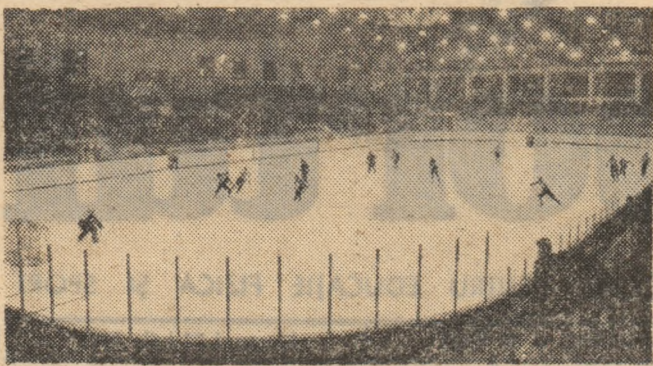
Patinoarul artificial din Galați

Ceea ce s-a realizat, în planul construcțiilor sportive de anvergură, este cu adevărat impresionant. La Rimnicu Vilcea și Riești, la Poza Mare și Iași, la Tulcea și Alexandria, la Timișoara, Bacău ș.a. au apărut noi și noi lăcașuri ale sportului, care ilustrează cu toată convingerea sprijinul