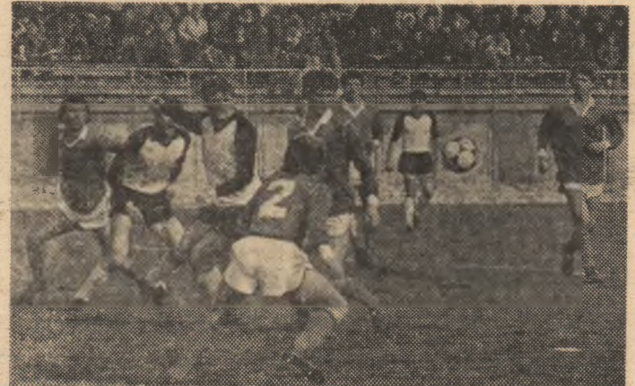
Ca de obicei, apariția Chimiei (tricoturi de culoare închisă) este încolțită. De data acesta îi face zile grele atacul Sportului Studențesc, animat de Coraș.

ANTRENORI: Gr. Sichițiu, Petculescu, Al. Moldovan, Păncu, I. Pătrașcu, Gh. Șoimăteanu.