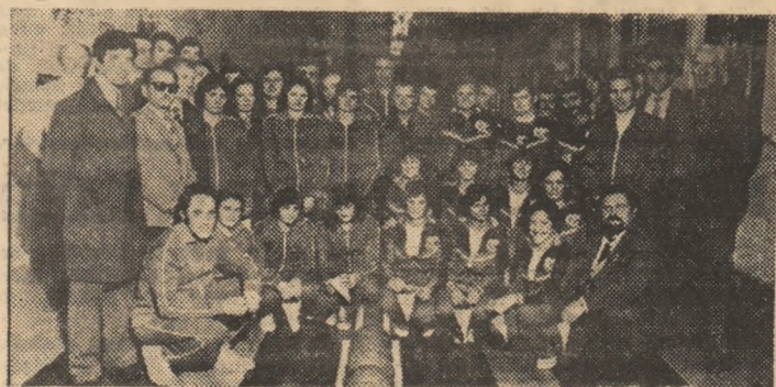
Valorosul nucleu al popicilor, împreună cu nelipsiții suporteri - cu toți tovarășii de muncă.