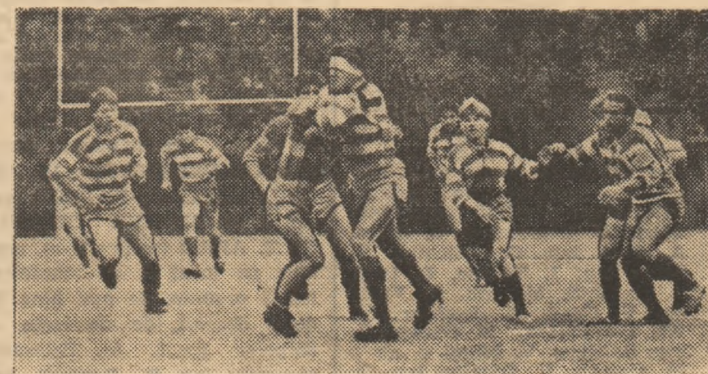
O fază „aprinsă“ din meciul Rulmentul Birlad - Politehnica Iași, finala „Cupei României“ din acest an, în care cele două formații s-au angajat mult mai convingător decît în partidele de campionat...

După ce, într-un prim comentariu a fost analizată evoluția frunzeșilor Diviziei A de ȘTIINȚA PETROȘANI (locul