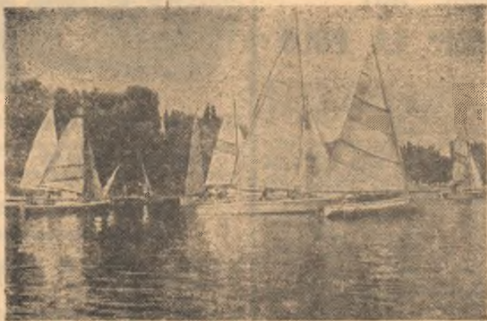
Ambarcațiunile sînt gata pentru startul în regata duminicală din cadrul „Serbărilor studențești Tei '87"

turle nautice și prof. D. Răducanu (Institutul de Construcții), pentru jocurile sportive.