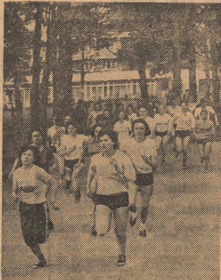
Atletismul (în speță alergările de cros) constituie o prezență permanentă în activitățile sportiv-educative ale elevilor din Sibiu.

● CÎȘTIG LUI PRONC TEMBRIE 11 Categorica varianta 100 varianta 25% Categorica varianta 100 varianta 25% Categorica