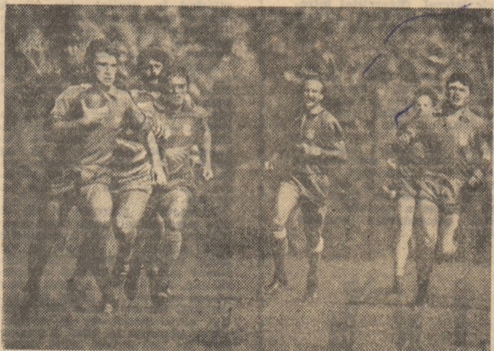
Scorul etapei precedente în Divizia A - seria I la rugby l-a realizat Steaua: 45-22 în meciul cu Știința Petroșani, de la care vă prezentăm această fază, cu tînărul Șerban în plină acțiune. Miine, Steaua și secundantele sale în clasament susțin partide în deplasare, după programul pe care îl publicăm în pag. 2-3.