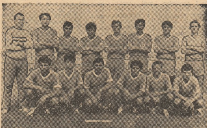
Dinamo București — la al 15-lea titlu de campioană

Stadionul Parcul Copilului din Capitală găzduiește astăzi, cu începere de la ora 14, o acțiune de trial a lotului reprezentativ de rugby. Sînt convocați componenții ai selecționatei A și de tineret.