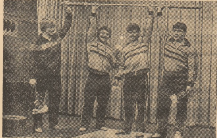
O imagine care se constituie în... cel mai exigent „control tehnic de calitate”: multipli noștri medaliați olimpici, mondiali și europeni își pun girul pe bara de concepție românească.

ționează să devină cunoscută, și prin sport, peste hotare), că un „Trofeu I.M.U.A.B.”, va răsplăti, anual, cea mai bună performanță a unui halterofil român, că în calendarul anului viitor va fi inclusă și „Cupa I.M.U.A.B.” pentru juniori, întrecere ce va fi tradițională, și a cărei echipă câștigătoare va fi răsplătită cu... o bară de haltere. Să recunoaștem, chiar dacă n-am mai amintit și de cei 22 de tineri nov-legitimați în secția de haltere, tot n-ar fi puțin... Vom încheia, amintind promisiunea reciprocă a unei reîntîlniri. Prilejul - inaugurarea victorului club al I.M.U.A.B., cînd unul din punctele incluse în program va fi, negreșit, o demonstrație de haltere.