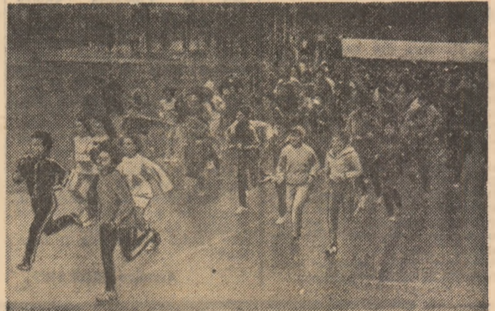
La start, studențele, care au avut de acoperit un traseu de 1200 de metri...

Să menționăm și faptul că în zilele precedente, tot la I.P.B. a avut loc o tradițională întrecere sportivă de masă, acum la a III-a ediție, „Electrotehnică”, competiție cu participarea