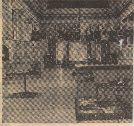
Citeva dintre numeroasele și atractivele prahoveane

În Sala Coloanelor a Palatului Cultural din Ploiești s-a deschis o expoziție dedicată „Sportului prahovean de-a lungul anilor”. Iată o inițiativă pe plan județean pilduitoare — o sursă sigură (daca inițiativa ar fi urmată în cit mai multe locuri) pentru alcătuirea unui fond de testimonii materiale atât de necesar istoriei generale a sportului românesc.