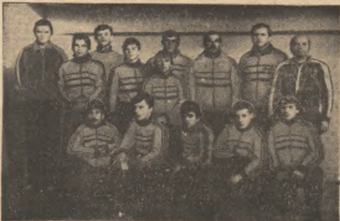
Echipa clubului Steaua, la cel de al 27-lea titlu de campioană la lupte libere Foto: Victor SECĂREANU — Brașov