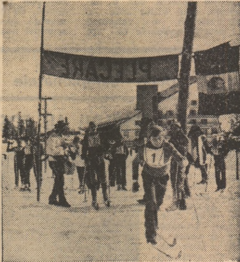
Prima recreație a anului școlar — vacanța de iarnă — constituie o invitație pe pîrtii și pe patinoare

La ordinea zilei vor fi, de pildă, cluburile de vacanță. Ele sînt organizate cu precădere în unități de învățămînt care dispun de săli și amenajări sportive în aer liber, terenuri pentru „jocuri” care s-au transformat ad-hoc, în aceste zile, în patinoare. Zăpada destul de abundentă care s-a așternut aproape în întreaga țară a susținut în întimpinarea Conferinței Naționale a partidului, Altele urmează acum, fiind de cît și în comune, așa cum ne-au și demonstrat întrecerile pe care elevii și studenții le-au