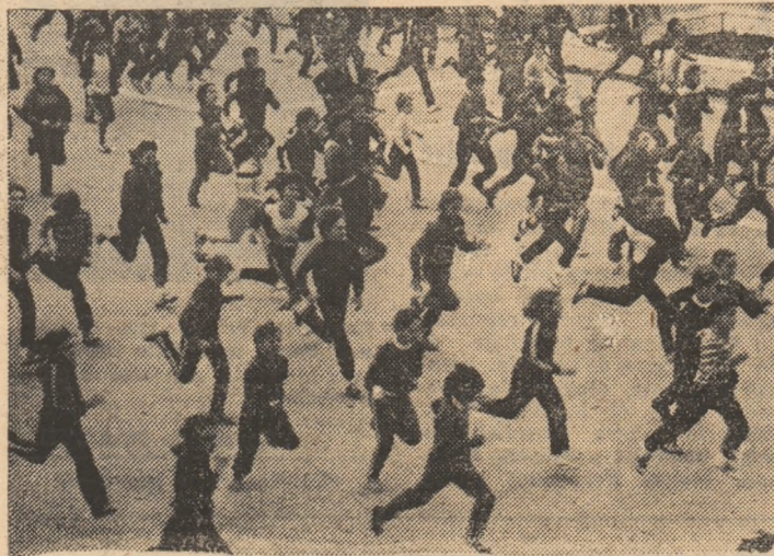
Alergările de cros — chiar și acum, țarna — sînt mult îndrăgite de purtătorii cravatei roșii cu tricolor...

După primul tur al campionatului juniorilor la handbal