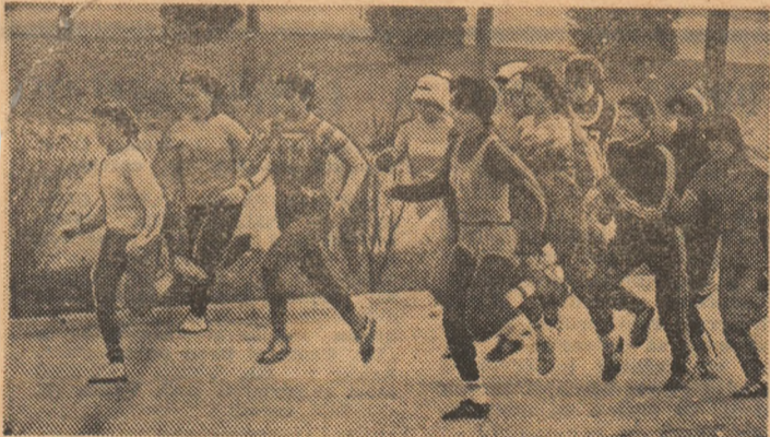
Sorite și însă la cros, în proba rezervată fetelor, categoria peste 19 ani. Este grupul frunțos, care s-a detașat dintr-un masiv pluton de sportive prezente la această frumoasă întrecere...