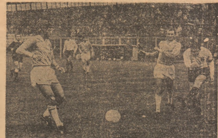
Șutează Coraș, dar Oancea — reprofilat pe poziție de libero — se află la post și respinge balonul, cum a făcut-o cu succes în multe din partidele turului.

● mobilizare exemplară în partidele-cheie disputate pe teren propriu;