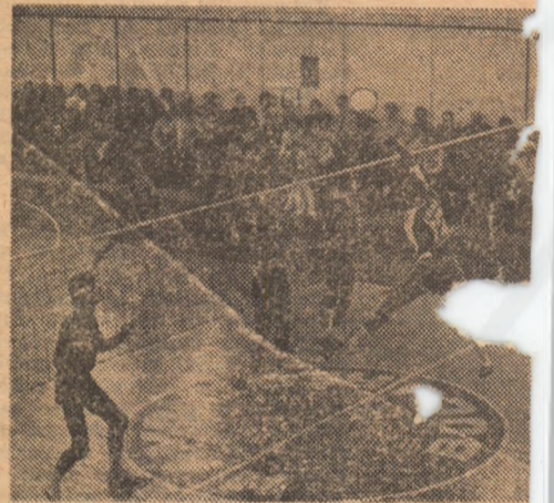
Fază spectaculoasă surprinsă la ultimul den de volei disputat de Dinamo și Steaua

genitate mai vistă a den de duminică re în toată în măsură riența mai tre echipa și M. Păușe ținea cam varietății adus unele națiilor pe loricînd t. tălile reale tor. Poate și reușit D asemenea, t. tribuția ma părării celo e remarcă din linia în aproape de sul vădit c agresivitate în forță și, l-a incomor pincor. Să a namo cît monștrat c. ofere spec callitate, ca săl o parte dut de vole Dar și c A ar trebu