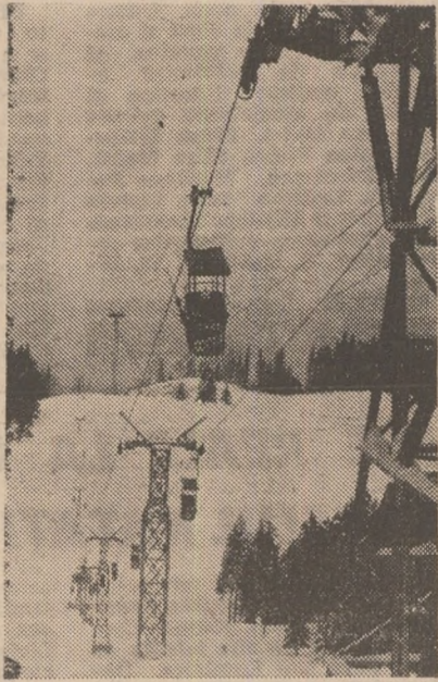
Telescaunul din Poiana Brașov funcționează zi-lumină în aceste zile, cînd zăpada mai rezistă pe Cristianul Mare.

O interesantă competiție de biatlon se va desfășura începînd de astăzi pînă duminică, pe Valea Rîșnoavei, în gîdă Predeal. Este vorba de „Cupa Dinamo Brașov” întrecere tradițională. Cum la starturi vor fi prezente și cîteva biatloniști de la puștinic club din R. D. Germană. Dynamo Zinwald Cupa Dinamo din acest an capătă și un caracter internațional. Într-o program, vineri: 20 km seniori și 15 km juniori; duminică: probele de ștafetă.