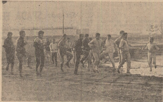
Secvență de la unul dintre antrenamentele fotbalistilor din Tg. Mureș. Cu puține minute înainte ei trecuseră cu succes testul de rezistență fizică.