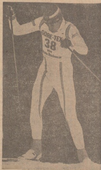
Impetuosul Gunde Svan, în pas de patinaj, spre o nouă medalie olimpică?

Și schiul de fond masculin a avut un personaj de prim-plan, chiar dacă strălucirea medalilor sale n-a fost, în totalitate, de aur, la Sarajevo: suedezul Gunde Svan. Spre deosebire de Haema-lainen, Gunde Svan s-a aruncat cu o forță greu de stăvilit în mai toate confruntările care au urmat, efectul fiind dominația aproape abso-