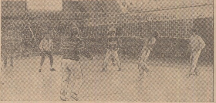
Fază dintr-un meci de volei? Nu. O demonstrație a fotbalistilor de la Sportul Studențesc, că în procesul de antrenament intră și sporturi complementare.

mele jocuri de verificare; 1-6 februarie, turneu arădean în compania unor echipe din zonă urmat de alte partide de verificare. ● Lotul de jucători surprins în perioada „Bușteni“: Cristian, Voicilă, Lucescu, — portari; M. Marian, M. Popa, Munteanu II, Ciucă, Bucico — fundasi; Țicleanu, Pană, Coraș, Cristea, Achim, Pologea, Motroc II, Răduță — mijlocași; Țirlea, S. Răducanu, Stănci, Ivașcu, Burchel — înaintași. Despre noii jucători: Răduță — tehnică bună, fotbalist rapid care „dă și pleacă“, Motroc II — jucător cu mare rază de acțiune, gabarit, Ivașcu —