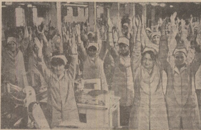
Un moment sugestiv al reprizei de gimnastică la locul de muncă surprins la I.P.I. Vilceana din Rm. Vilcea

O subliniere care exprimă o realitate. La I.P.I. Vilceana, într-adevăr, gimnastica la locul de muncă s-a integrat profund în viața colectivelor de secții și sectoare, încă de acum 15 ani. O activitate care n-a început, oricum, la întâmplare. Mai întâi, conducerea întreprinderii, Comitetul de partid și Comitetul sindicatului au stabilit locurile de muncă în care cele 3-5 minute de exerciții în sprijinul sănătății, al refacerii și creșterii capacității de producție beneficiază de cele mai bune condiții de desfășurare. În același timp, s-a asigurat acestor acțiuni o bună popularizare prin articole la gazeta de perete, afișe și materiale documentare. După aceea au fost selectate tinere muncitoare pentru un curs special de instruire; cite 2-3 pe fiecare secție și schimb de producție. O acțiune în care cei de la I.P.I. Vilceana au primit