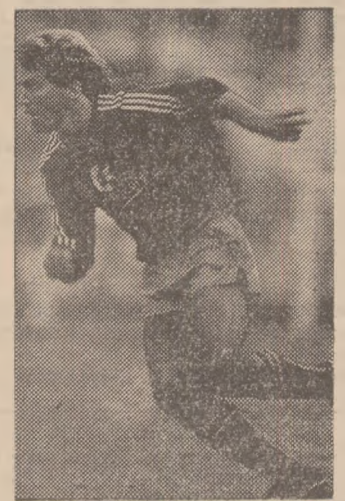
Lothar Matthaus, unul dintre jucătorii de bază de la Bayern München. Pînă cînd? Se pare că în viitorul sezon el va evolua la Internazionale

samente: punct de plecare al comentariului nostru: 1) „Adevărul”: Bremen +12; F.C. Köln +10; Bayern München +7; Mönchengladbach +6... Dortmund, Schalke, Bochum, Uerdlingen — cîte -5; Homburg -7; 2)