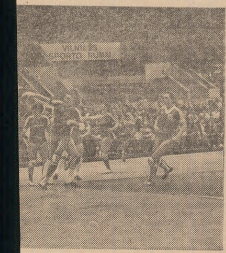
anca Rodica Marian, cea mai bună a meciului Egle — Rulmentul, într-o caracteristică acțiune pe semicerc o: Petras PETRUSKEVICIUS — Vilnius

), munca ce se activă kilome- ANTAL 55,9, 2. a Baia xandru a 07:15,8, Dinamo Gabor 3,7, 6. Sibiu) ori III: NESCU 46,1, 2. Bistrița) Gheor- ne Ti- Sprle) CSȘ 6. Ovi- 32:27,0. cursa este inte- pen- ceastă nfrun- ort de v.