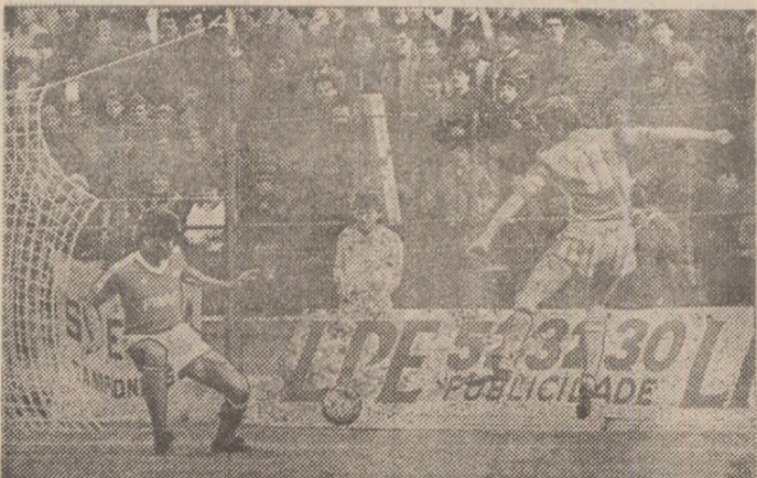
Gh. Popescu (nr. 11) centrează balonul spre poarta lui Silvino sub privirile lui Pacheco. Moment din partida-tur de miercuri