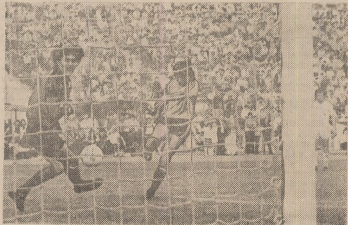
Lăcătuș înscrie al patrulea gol al „tricolorilor”

A fost o partidă cu destule momente frumoase, gustate de public. Schimbările efectuate după pauză nu au afectat jocul „tricolorilor”, care s-au „găsit”