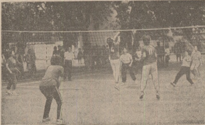
Și voleiul are mulți simpatizanți și practicanți