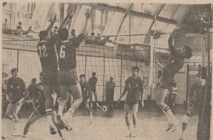
La atacul stelistului Pentelescu. Rotar și Căta-Chițiga opun, această dată, un blocaj eficient.