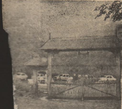
...care pare să stă scris „Automobilism ma- ...portă și statuți de lemn au parcat