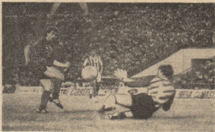
Pena inscrie al doilea gol al său în finala „Cupei Steaua”, în care s-au întîlnit campioana noastră și Partizan Belgrad