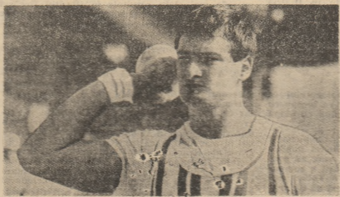
Ulf Timmermann (născut la 1 noiembrie 1962, în Berlin) a deschis, cu nouă sau record mondial în proba de aruncare a greutății, seria formidabilelor rezultate cu care atletismul mondial întâmpină Jocurile Olimpice de vară...