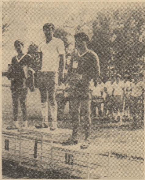
Pe podium, cîpitanii echipelor clasate pe primele trei locuri.

După cum se știe, ediția a 18-a a „Cupei U.G.S.R.” la oină, desfășurată în Municipiul Pitești, s-a încheiat cu victoria echipei bucureștene Combinatul Poligrafic. În rîndurile de mai jos vom încerca să redăm cîteva aspecte din culisele concursului, precum și unele date, mai interesante, despre cîteva echipe participante.