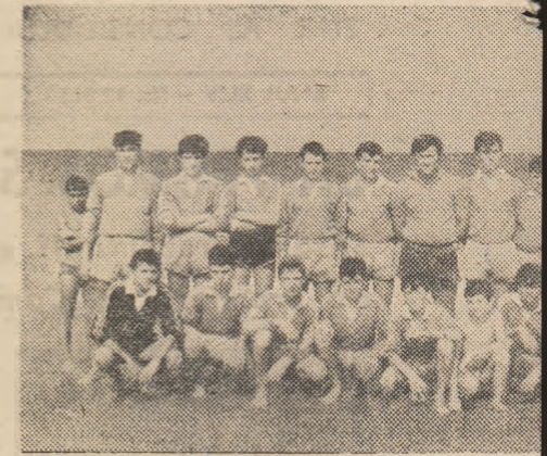
Oimștii din Dăbuleni (Dolj), învingători în „Cupei Pionierului”

spectaculoase, de bună factură tehnică, echilibrate: 1. Casa Pionierului Dăbuleni 19 p., 2. Șc. gen. Turnu Roșu (jud. Sibiu) 18 p (+27), 3. Șc. gen. Gherăești (Neamț) 18 p (+26), stadionul „galeria, întregul” au ratat festivalul național, organizare