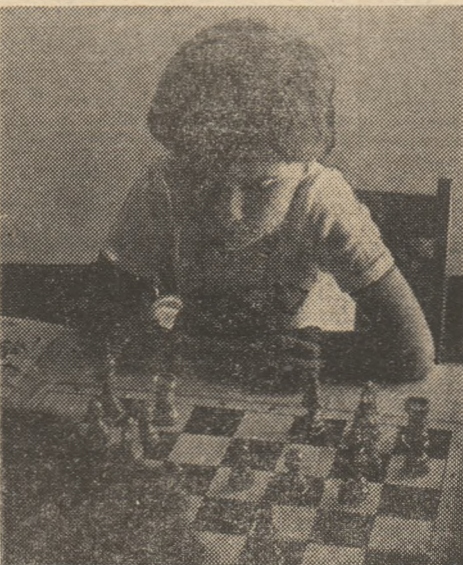
Mica noastră... mare campioană, la masa de joc, înaintea ultimei runde...