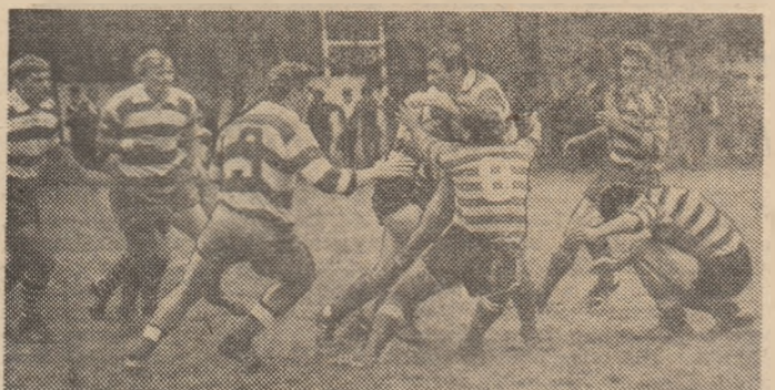
Totdeauna decisiv, înaintarea Rapidului s-a impus cu autoritate în meciul cu C.F.R. Constanța

FEMININ, seria I: Voința București - Calculatorul București 0-3. Comerțul Constanța - I. T. București 3-0, C. P. București - Hidrotehnica Focșani 3-0 (prezentare), ACMRIC Fiața Neamț - Colplex Constanța 3-1, Știința Bacău - Flintex Fălticeni 3-0. Bralcof Brăila - Metal 33 București 3-0; seria a II-a: Vîltorul IGCI, Petroșani - ASSU Craiova