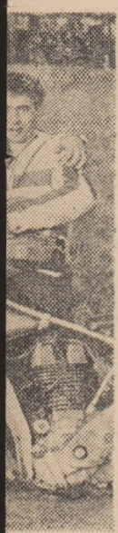
Viță și Vice-campion al...