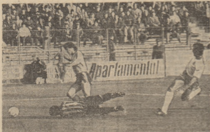
Lăcătuș o pătruns în careu, portarul Talikriadis îl oprește prin fault, dar... jocul continuă