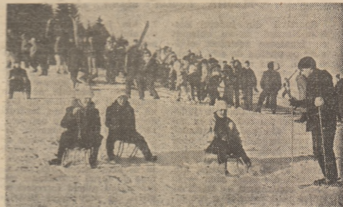
Foarte curînd asemenea imagini vom vedea la fața locului pe toate „arenale” sporturilor de iarnă...