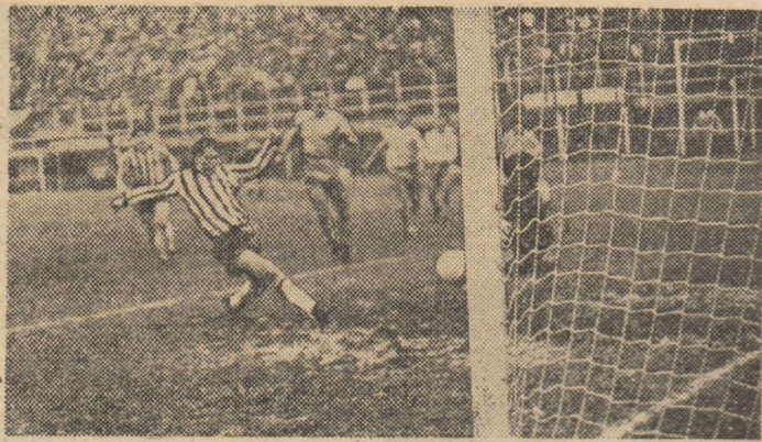
Rapid nu va căsi însă drumul spre egalare!

Damaschin II marchează în poarta Farului, reducând diferența de pe tabela de marcat la 1-2. Spre deziluzia tribunei.