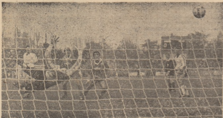
Minutul 82: Thompson plonjează disperat, dar mingea expediată de Mateuț se duce, bolid, la vințul porții scoțiene: 1-1 și... calificare!