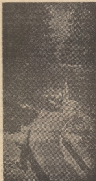
Imagine de pe pîrtia de sanie de la marginea comunei Sărmaș

Constatăm că la Sărmaș, în centrul civic, au apărut blocuri cu zeci de apartamente (alte 16 sînt în construcție), avînd la parter diverse spații comerciale. În zona centrului civic se află grădinițe, o centrală telefonică semiautomată, o școală cu sală de sport, terenuri de handbal, volei și baschet, precum și terenul comunal de fotbal. Oamenii de aici nu mai sînt nevoiți să dea o fugă pînă la Gheorgheni sau Toplița, orașe între care e situată această comună, pentru a-și rezolva diferitele probleme, deoarece au acum la ei acasă diverse unități prestatoare de servicii către populație, dispensar cu mai multe cabinete, farmacie și un centru de cultură și creație „Cîntarea Româ-