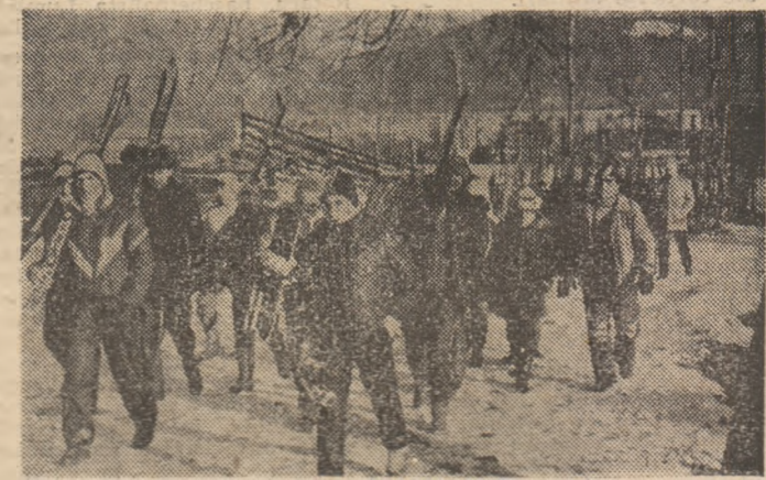
Frumusele zile ale acestei vacanțe de iarnă oferă elevilor întîlnirea cu pîrțile de schi și sanie, pretutindeni acolo unde s-a așternut manta albă de nea. Este un prilej binevenit pentru organizarea concursurilor școlare din cadrul Dacladel. Imaginația de față surprinde un moment al vacanței de iarnă, în vecinătatea pîrtilor din Cimpulung Moldovenesc.

Am cunoscut mulți tineri și vîrstnici, mari amatori de mișcare, mulți activiști sau instructori voluntari la care s-au înrădăcinat dorința și mîndria de a reprezenta cu cinste culorile asociației sportive în entuziastele concursuri ale Dacia-ului. Și zilele trecute am fost prezenți în mijlocul unor asemenea pasionați al exercițiului fizic: oameni de diverse