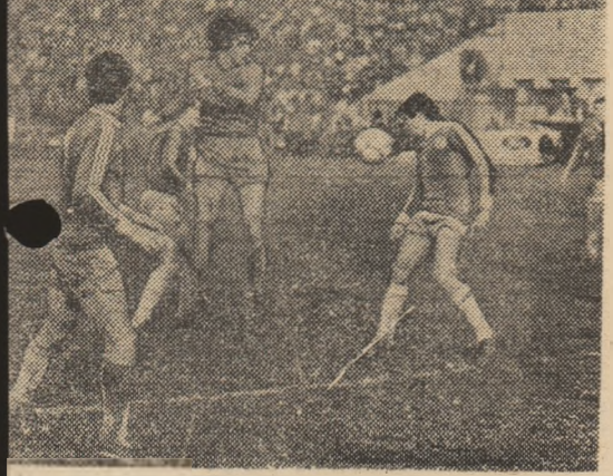
mul 11-0! Un nou atac stelist — al citelea? — lui Lăcătuș. În stînga, Hagi, autor a 5 goluri...

vorba vine, modificărilor surse se reinchege timarea ei în amintind din sul celei de-a