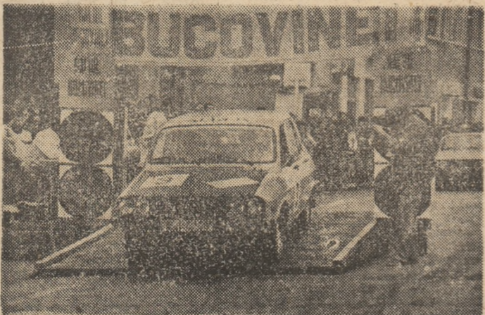
Plecarea campionilor absoluți într-un raliu pe care îl vor câștiga.

re au avut prilejul să le urmărească. Raliul Brașovului, Raliul Deltei, Raliul Harghitei, Raliul Bucovinei și Raliul Castanelor — Divizia A — au fost reușite din toate punctele de vedere, organele locale din județele Brașov, Tulcea, Harghita, Suceava și Maramureș