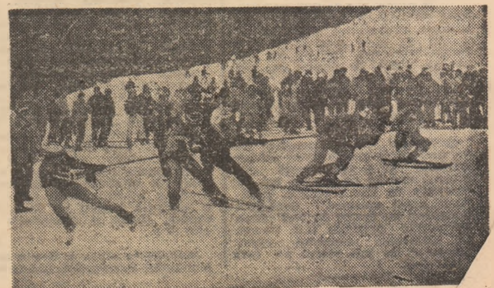
Partida de „trasul frînghiei”... pe schiuri, finală între tineri și petroșăneni.