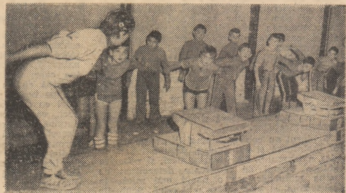
Pină la primele lansări de pe bloc-start, lecții pe uscat: bineînțeles, în ambianța cuceritoare a bazinelor...