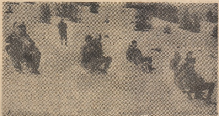
După un trimestru de intensă activitate pe băncile școlilor, elevii se află în zile de vacanță. Cu mișcare și sport în aer liber, zăpada fiind un „aliat” credincios, așa cum se poate observa și în instantaneul alăturat, surprins în tabăra organizată de C.C. al U.T.C., la Gura Humorului.