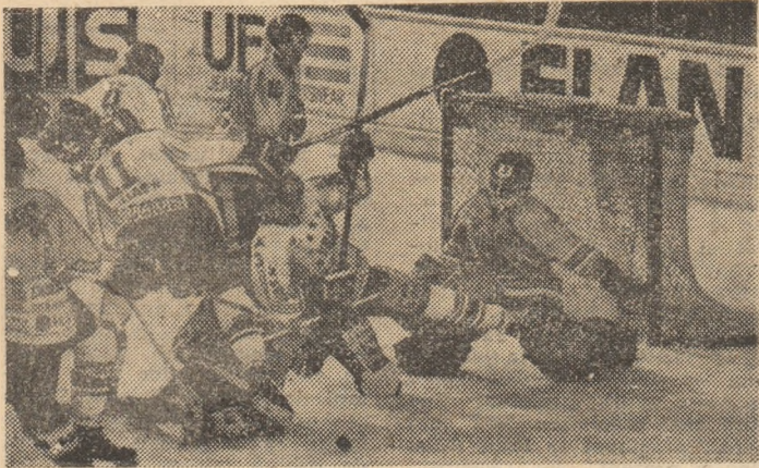
În majoritatea țărilor, întâlnirile de campionat și cele inter-țări, la hochei pe gheață se află în plină actualitate. În imagine, o spectaculoasă fază dintr-o partidă desfășurată la Viena.

Turneul de la Stuttgart s-a încheiat cu victoria unei selecționate din U.R.S.S., care în ultimul joc a întrecut cu 8-1 (2-0, 2-3, 4-1) echipa Poloniei. Pe locul doi s-a clasat formația R. F. Germania, învingătoare cu 8-7 (3-0, 3-4, 2-3) în fața echipei Elveției.