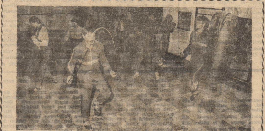
Vitiori boxeri valorosi la Rulmentul Birlad? De ce nu, din moment ce în această secție se muncește cu multă pasiune.