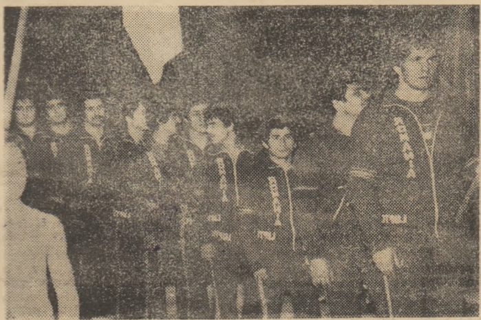
Campionul olimpic Vasile Pușcașu, aflat pînă acum mereu în fruntea lotului național de lupte libere

Miine (ora 16) și duminică (ora 10) are loc etapa de zonă a „naționalelor” în sala „23 August”, iar duminică viitoare, de la ora 9, crosul organizat de URBIS, și dotat cu „Cupa Unirii”. (Gh. LAZAR, coresp.)