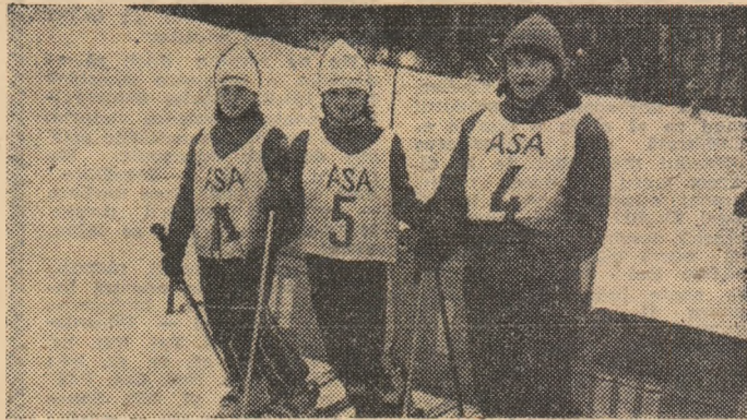
Numeroase medalii și premii au răsplătit pe cîștigători