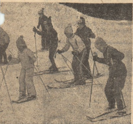
totdeauna, cei mai grei! Apoi, lucrurile sporește, căzăturile sînt din ce în ce

bătă și duminică este programat un concurs, de data aceasta în organizarea Mureșul Tg. Mureș.